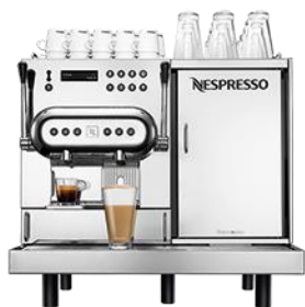
Machine Aguila 220

Fruit de l'esprit d' innovation constant de Nespresso, les machines à café professionnelles Nespresso Zenius, Aguila et Gemini sont des concentrés de technologie, de simplicité et d'esthétisme pour un usage intensif. Des solutions de paiement sur mesure sont possibles également grâce à l'offre Tower.