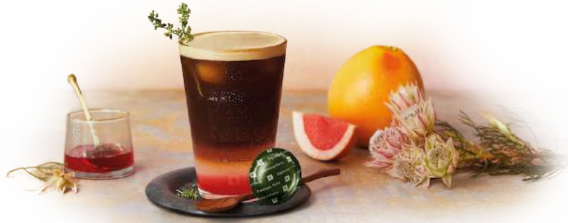
BITTER THYME SYMPHONY FOTO: NESPRESSO PROFESSIONAL NESPRESSO.COM/PRO/REZEpte